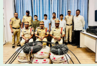
పాల్వంచ వద్ద మారల్లో వెల్లడైనవారు.